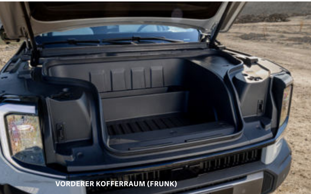
VORDERER KOFFERRAUM (FRUNK)