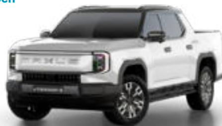
Pearl Lustre White